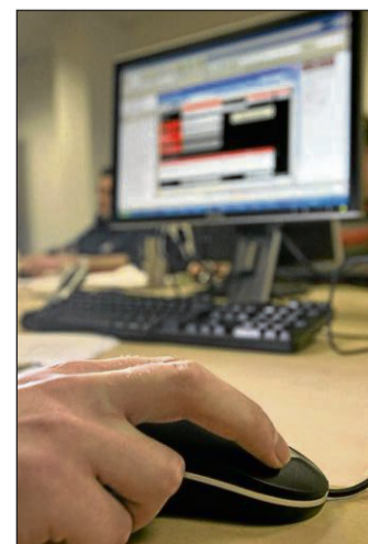
Kriminelle erpressen derzeit Computernutzer.

der abgerufen, abgespeichert sowie E-Mails mit terroristischem Hintergrund versandt. Das Sperren solle weitere Aktivitäten des Nutzers verhindern. Wer seinen Computer wieder nutzen wolle, müsse eine Strafe in Höhe von 100 Euro binnen 24 Stunden via Ukash-Coupon zahlen. Die Coupon-Nummer soll in ein Zahlungsformular eingegeben werden und via E-Mail an eine angebliche Adresse des BKA gesandt werden. Erfolgt keine Zahlung, werde die Festplatte gelöscht. Von dreister Online-Abzocke sprach Meisel. Betroffene Computer könnten mit einer Reparatur-CD gestartet werden, so Experten.