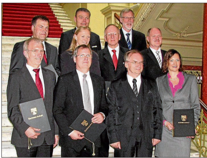
Gestern ernannte das neue Kabinett um Ministerpräsident Reiner Haseloff die Staatssekretäre während erster Sitzung.